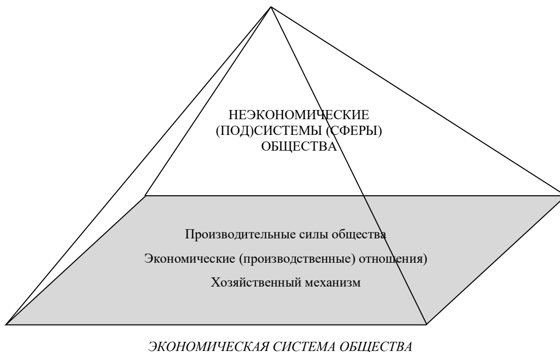
Рис. 1. Основные подсистемы (сферы) общества как системы

Общепризнано, что фундаментом жизнедеятельности любого общества (как системы) является его экономическая (под)система (сфера), имеющая, в свою очередь, свои определенные структурообразующие элементы (рис. 1), которые во взаимосвязи и взаимодействии образуют некую «несущую» конструкцию, обеспечивающую функционирование и развитие общественной системы в целом. При этом различного рода изменения, преобразования, трансформации и пр., происходящие в экономической системе общества, в общественном способе производства неизбежно обуславливают соответствующие перемены и трансформации в других сферах (социальной, правовой, политической, духовной, культурной и др.) общественной системы. Хотя, как показывает мировой опыт, в краткосрочном периоде сама экономическая система может изменяться и трансформироваться под воздействием и влиянием перемен и трансформаций, происходящих в неэкономических сферах общественной системы. Поэтому очевидно, что какие-либо управленческие воздействия (со стороны субъектов управления, ведущим из которых является государство), в отношении экономической системы должны разрабатываться и осуществляться с учетом ее диалектического единства, взаимосвязи и взаимодействия с другими подсистемами (сферами) общественной системы (социальной, политической, экологической и др.).