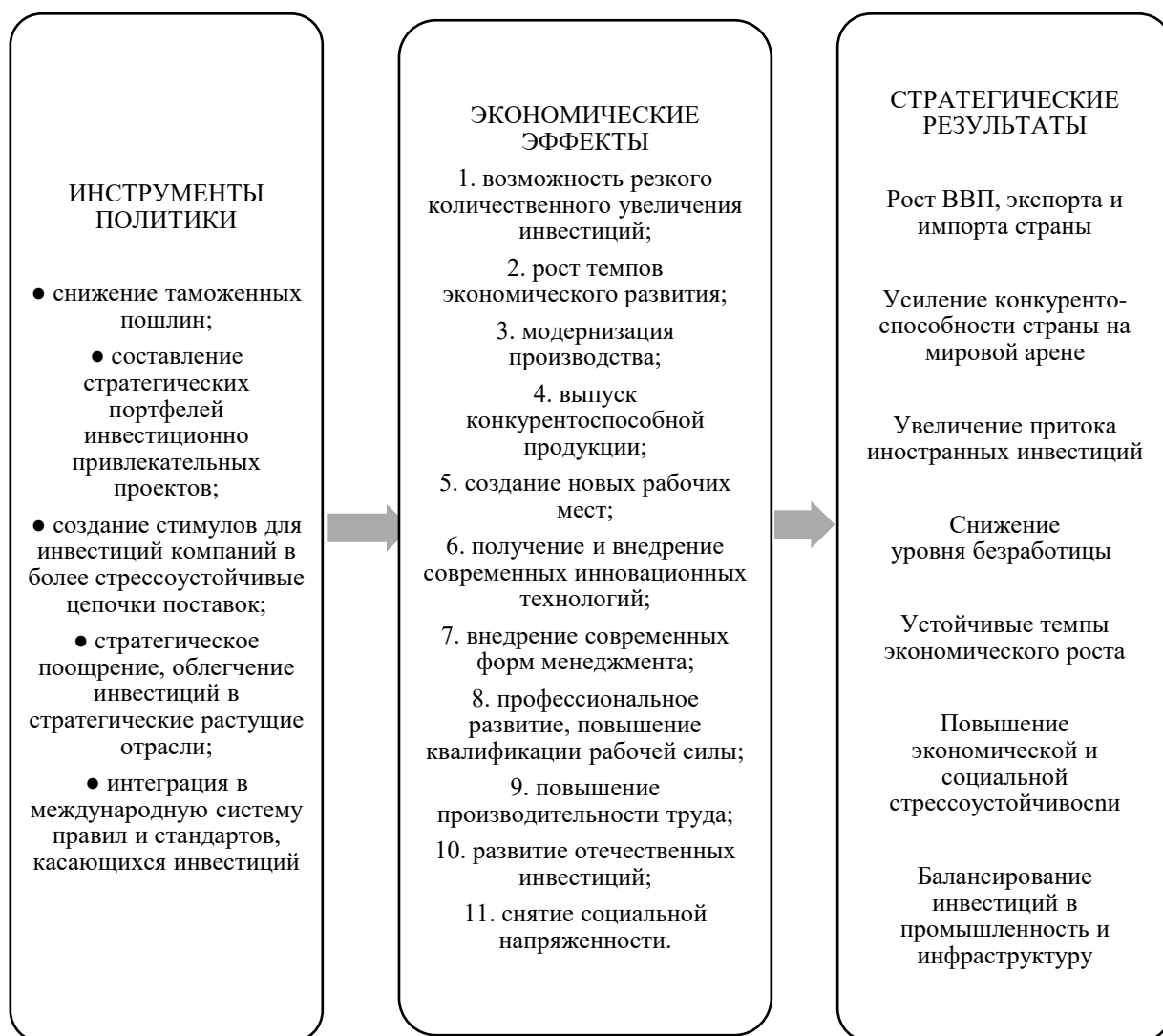
Рис. 3. Направления реализации устойчивого инвестиционного развития в Российской Федерации

С учетом необходимости формирования эффективной инвестиционной стратегии, представляется необходимым структурировать направления реализации устойчивого инвестиционного развития Российской Федерации (рис. 3).