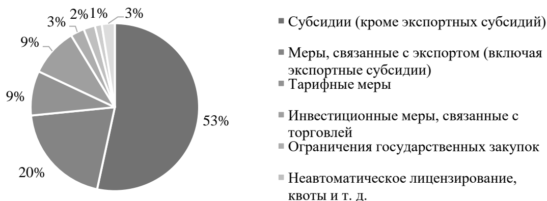
Рис. 2. Структура протекционистских вмешательств в торговлю, 2022 г. [9]

Большая часть этих протекционистских мер в торговле представлена в виде тарифов и субсидий (18792), 9 процентов мер связано с инвестициями (3276) и 1 процент (468) направлен на ПИИ (рис. 2).